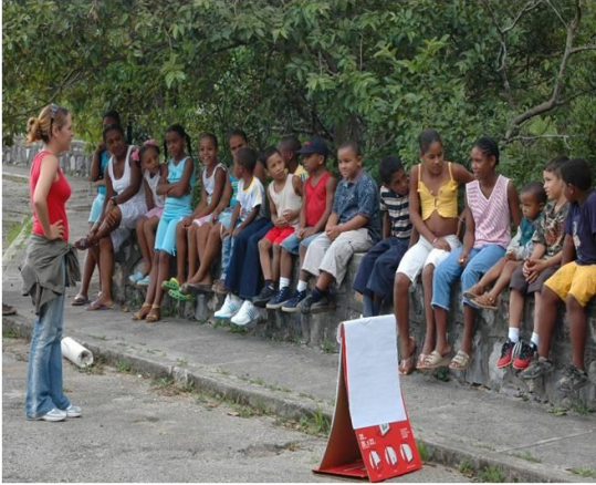
Figura 3. Actividad con los niños de las comunidades durante la apertura oficial del Conteo de Aves Rapaces Migratorias en La Gran Piedra.

proyecto y comunitarios para celebrar la apertura oficial del Conteo de Aves Rapaces Migratorias en Gran Piedra, con una participación de 12 niños, 6 adolescentes y 9 adultos de la comunidad (Figura 3).