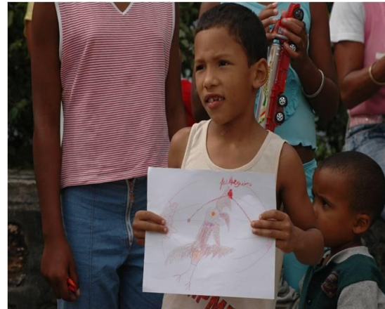
Figura 4. Niño de la Comunidad 1 mostrando uno de los dibujos que realizó durante la actividad de apertura oficial del Conteo de Aves Rapaces Migratorias en La Gran Piedra

Los dibujos que crearon los niños con ayuda de los adultos, una vez que se les explicó la ruta migratoria de las aves y los peligros que enfrentan para lograr el éxito de llegada a su destino final, lograron sensibilizarlos acerca de lo que se les había enseñado respecto al tema (Figura 4). Durante el intercambio de preguntas y respuestas se evidenció que hubo asimilación de conocimientos y aprendizajes por parte de los comunitarios.