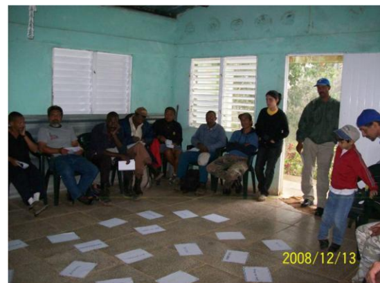
Figura 5. Uno de los talleres desarrollados con los comunitarios de la zona alta de la Gran Piedra, Santiago de Cuba, Cuba.

Durante tres días de trabajo, del período de conteo 2009, se realizaron los talleres con una hora de duración cada uno, y una asistencia de 20 pobladores; la edad comprendida oscilaba entre los 25 y 70 años (Figura 5). Siguiendo la metodología de la Educación Popular, comenzamos desarrollando una serie de dinámicas que nos permitieron una presentación liberada sin cohibiciones y la integración del grupo. Reconociendo que, el que se conociese la mayoría, fue un punto favorable para un encuadre positivo en el inicio del taller que se mantuvo durante los tres días de trabajo.