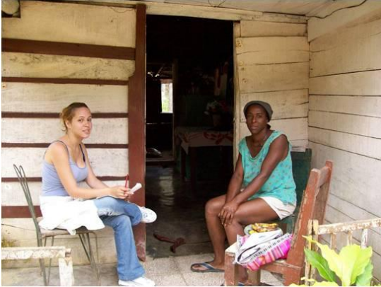
Figura 2. Entrevista realizada a uno de los habitantes de la Comunidad 3, en la zona alta de la Gran Piedra, Santiago de Cuba, Cuba.